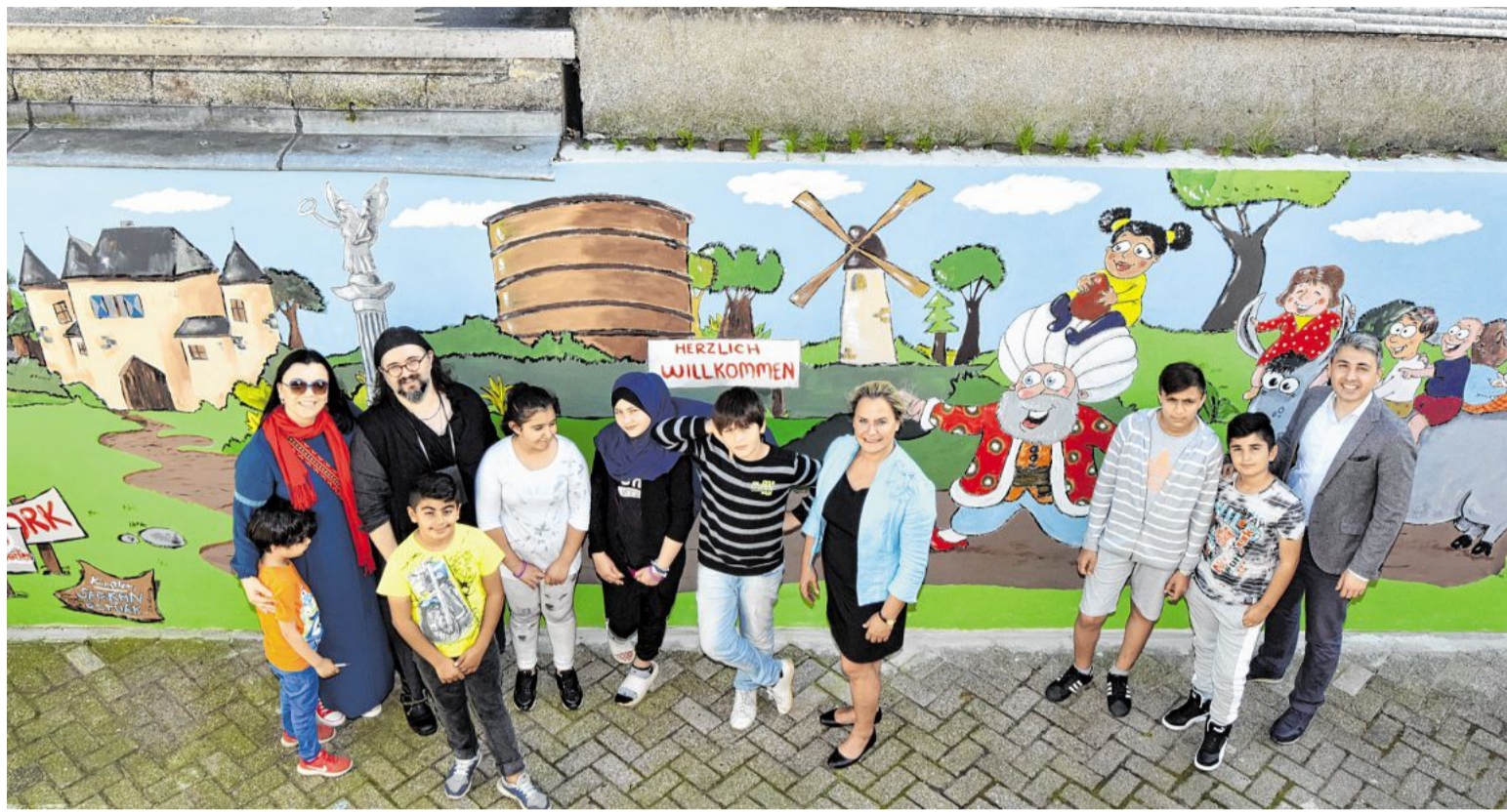
Künstler, Kinder und Unterstützer vor dem großen Wandbild in der Unterkunft an der Duisburger Straße.

Lirich. Zu einem Unfall kam es im Verlauf einer Trunkenheitsfahrt im Stadtteil Lirich: Eine betrunkene Autofahrerin beschädigte auf der Ulmenstraße laut Polizei einen geparkten Audi. Zu der Kollision kam es am vorigen Samstag gegen 5.30 Uhr. Die 48-jährige Frau blieb bei dem Zusammenprall unverletzt. Es entstand ein Gesamtsachschaden von rund 1800 Euro. Ein Alco-Test ergab bei der Fahrerin einen Wert von über 0,8 Promille. Eine Blutprobenentnahme wurde angeordnet und der Führerschein der Fahrerin wurde vor Ort von den Beamten sichergestellt.